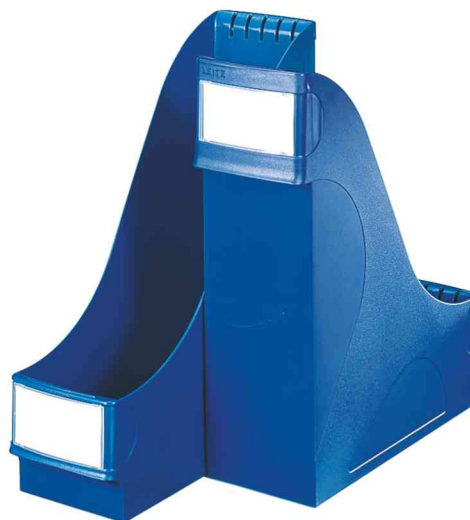
Porte-revues extra large