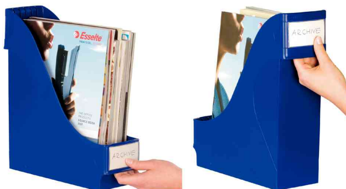
Porte-revues extra large, creux de préhension à l'avant et à l'arrière